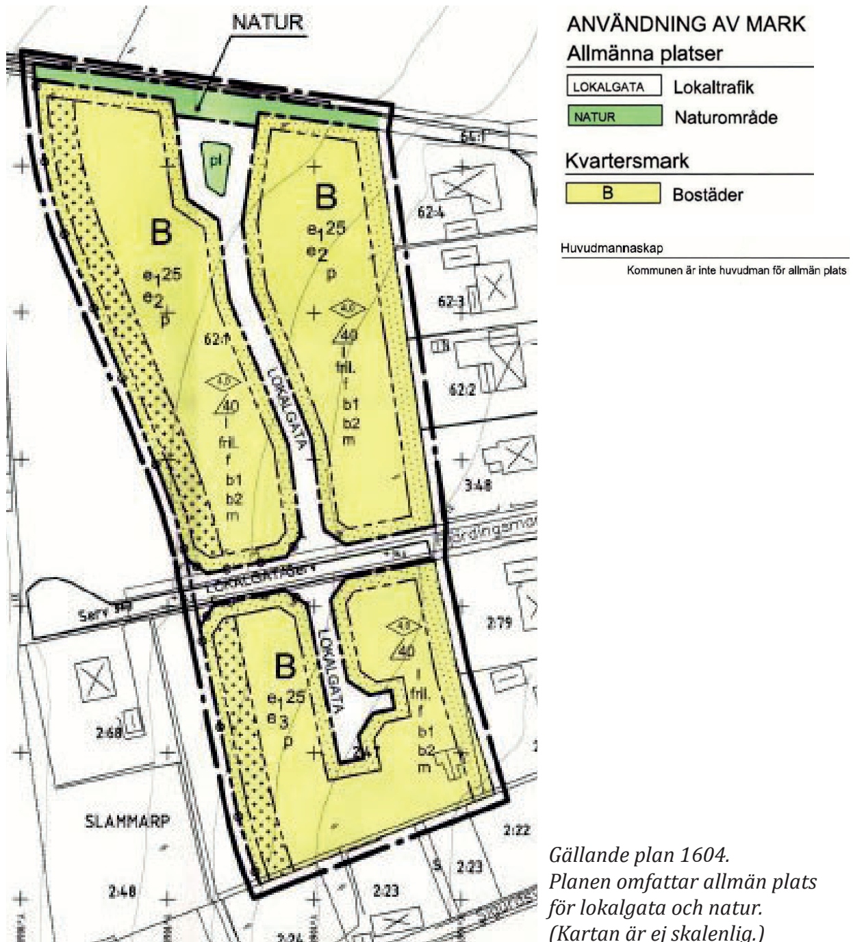
Gällande plan 1604. Planen omfattar allmän plats för lokalgata och natur. (Kartan är ej skalenlig.)

Planen medger kvartersmark för bostäder. Planen innehåller allmän platsmark i form av lokalgata och natur. På plankartan finns en administrativ bestämmelse om att kommunen inte är huvudman för allmän plats.